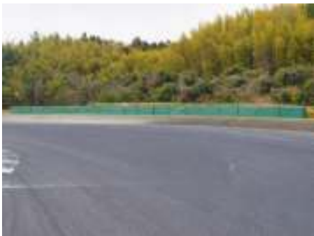
1 コーナーアウト側 (2輪・4輪共通)