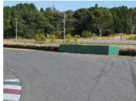
2 コーナーアウト側 (2輪フルコース走行日 および2輪Gコース貸切日)